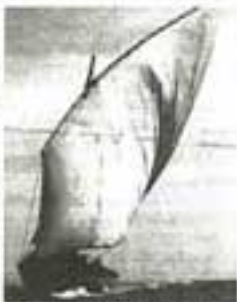
Banco tradicional de pesca da Póvoa